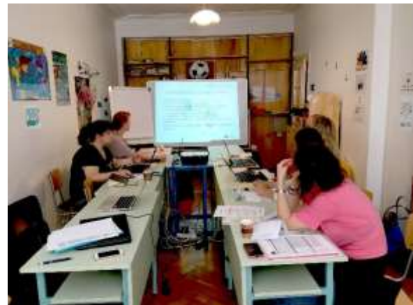
2. Projekt Partner Meeting in Sofia, Juni 2017

Nachdem in den letzten Monaten intensiv nach informellen Skills recherchiert wurde, stand auf der Hauptagenda des Meetings die Auswertung der Rechercheergebnisse, die Selektierung von transversalen Skills und Definierung der Branchen, die Vorbereitung der Fragebögen für innerhalb und außerhalb des Tourismus sowie die Vorbereitung des ersten Management Activity Reports. Darüber hinaus wurden zukünftige Schritte und